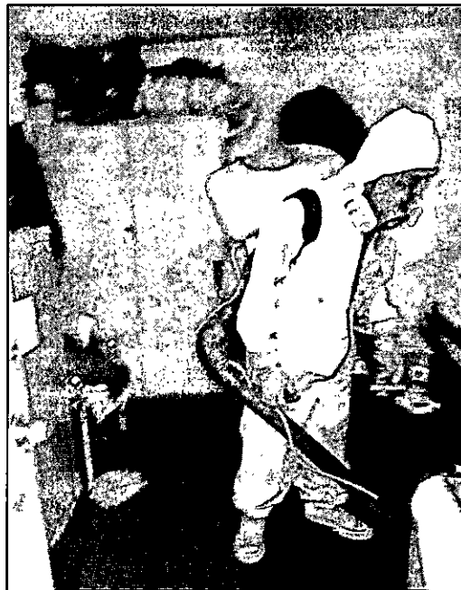
Fumigación realizada en domicilio de vecino de la comuna.