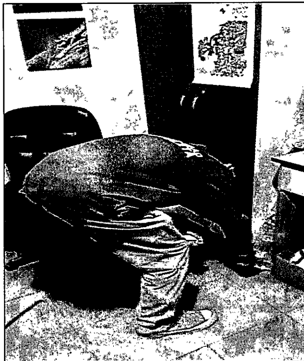
Desratización en casa de vecino Departamento de Control Ambiental